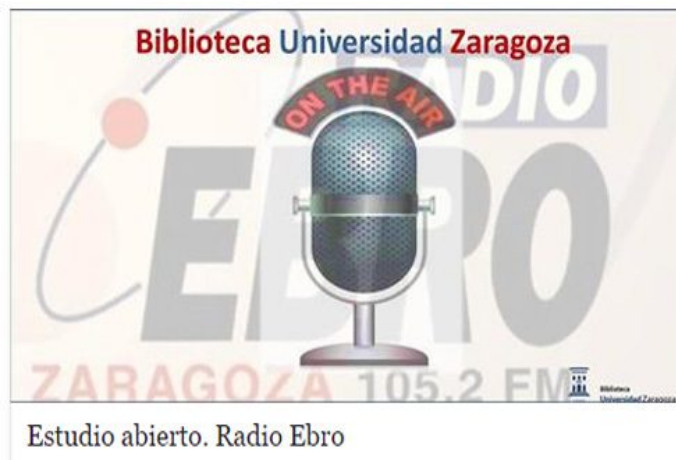
Estudio abierto. Radio Ebro