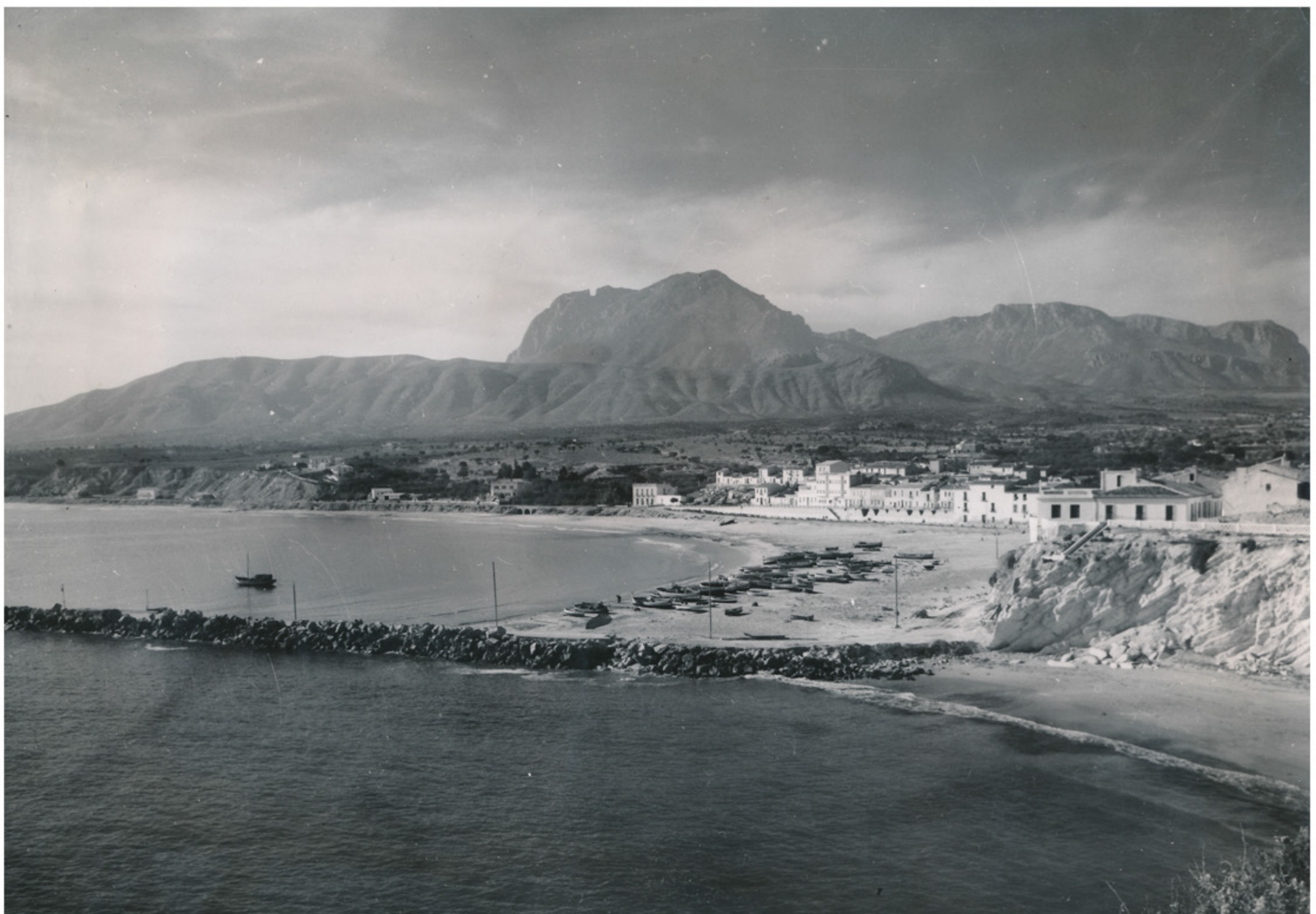
Vista de Benidorm - Fecha: 1954