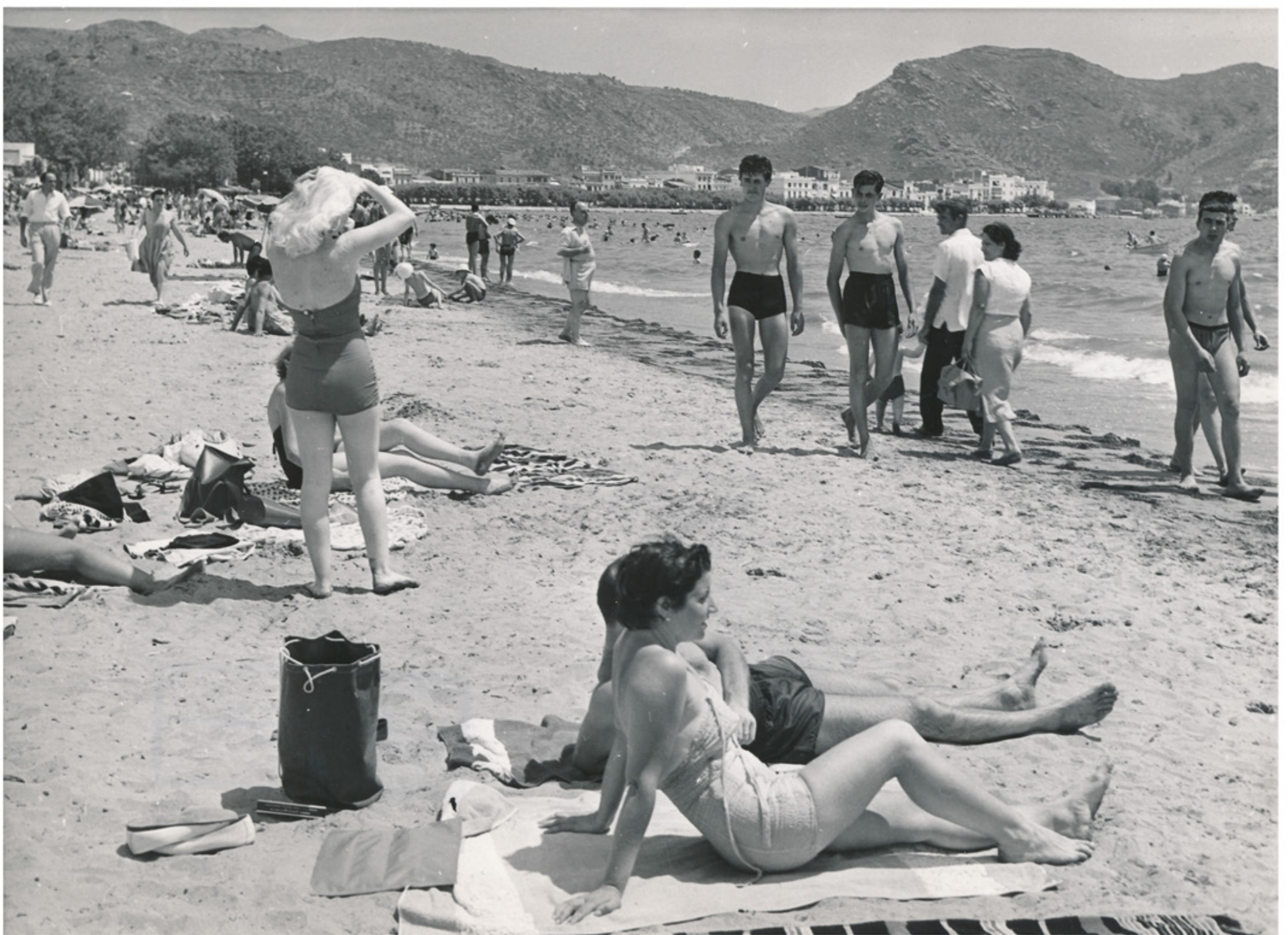
Playa de Roses -. Fecha: 1959