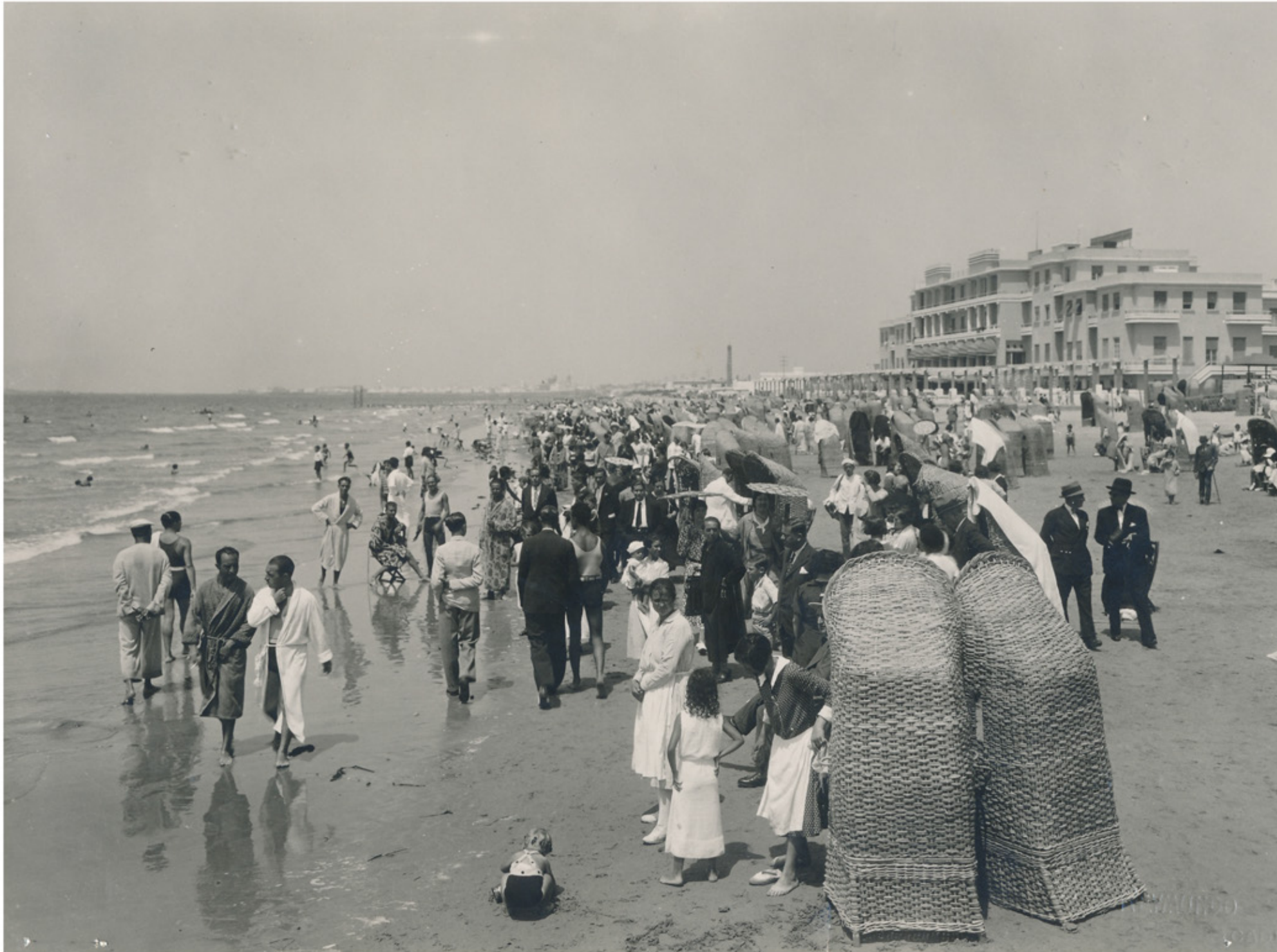
Playa de Cádiz. Fecha: c.1929