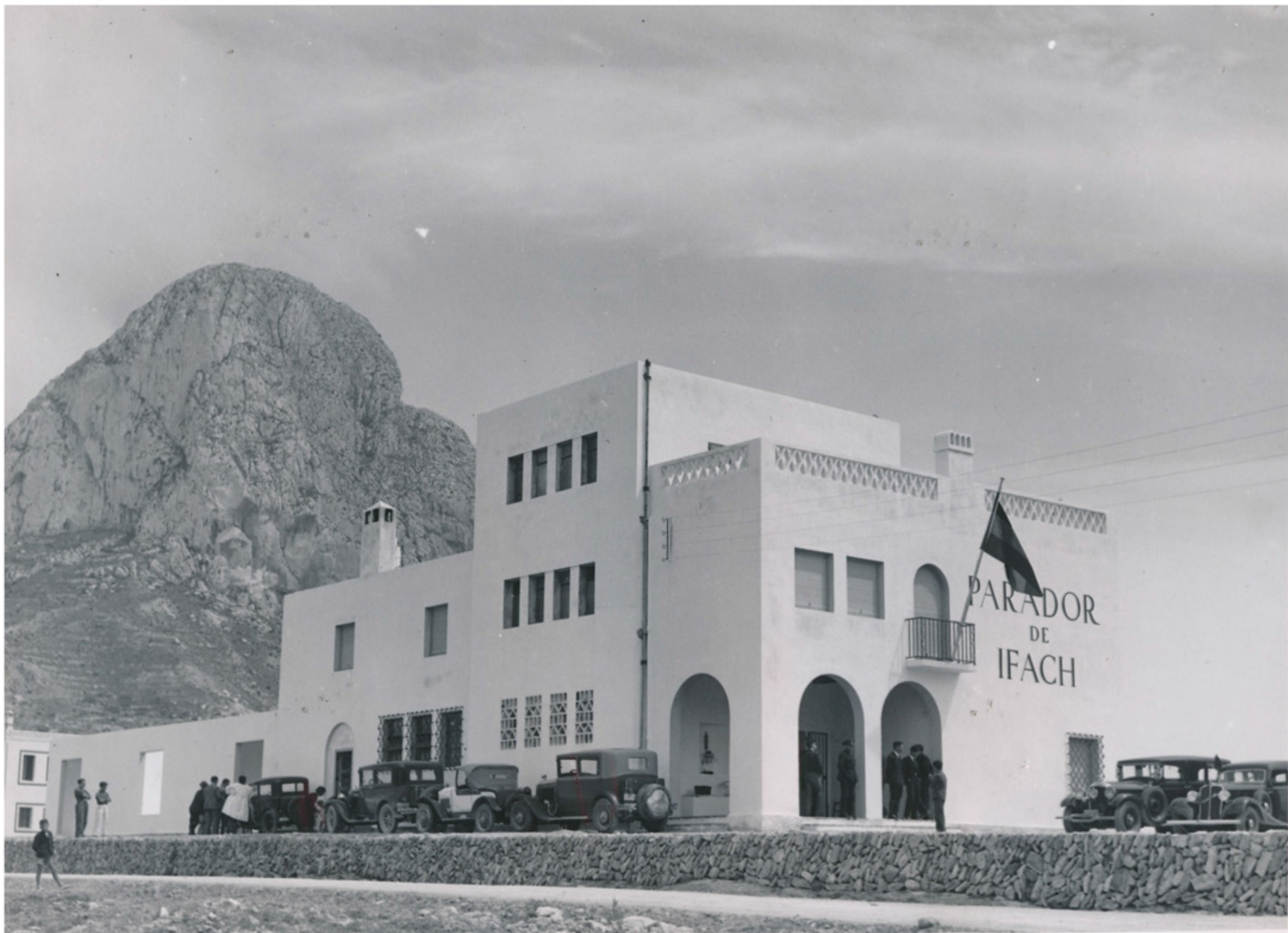
Parador de Ifach (Calpe, Alicante) -. Fecha: 1942