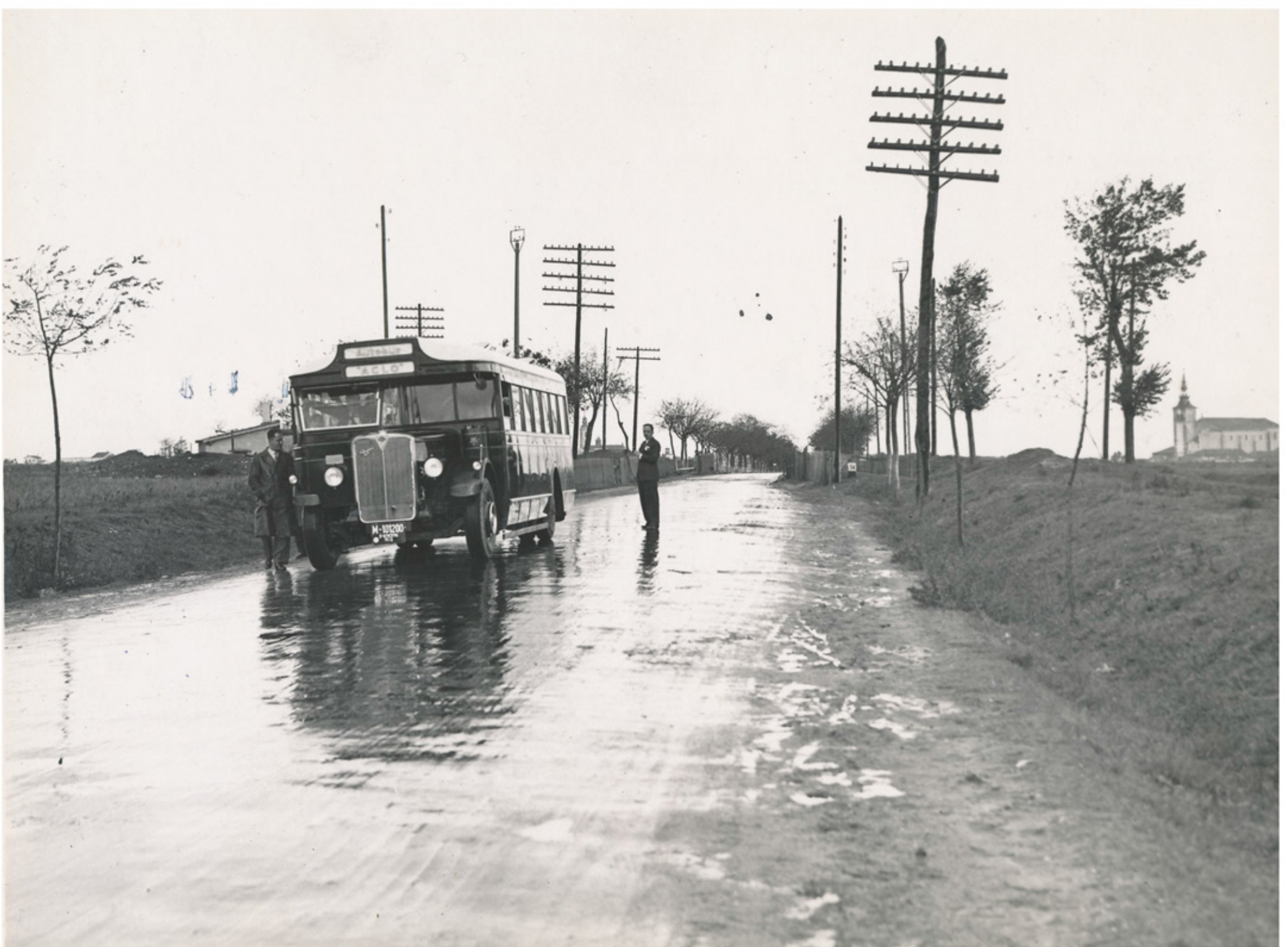
Carretera de Toledo en el km. 14 - Fecha: ¿1931-1936?