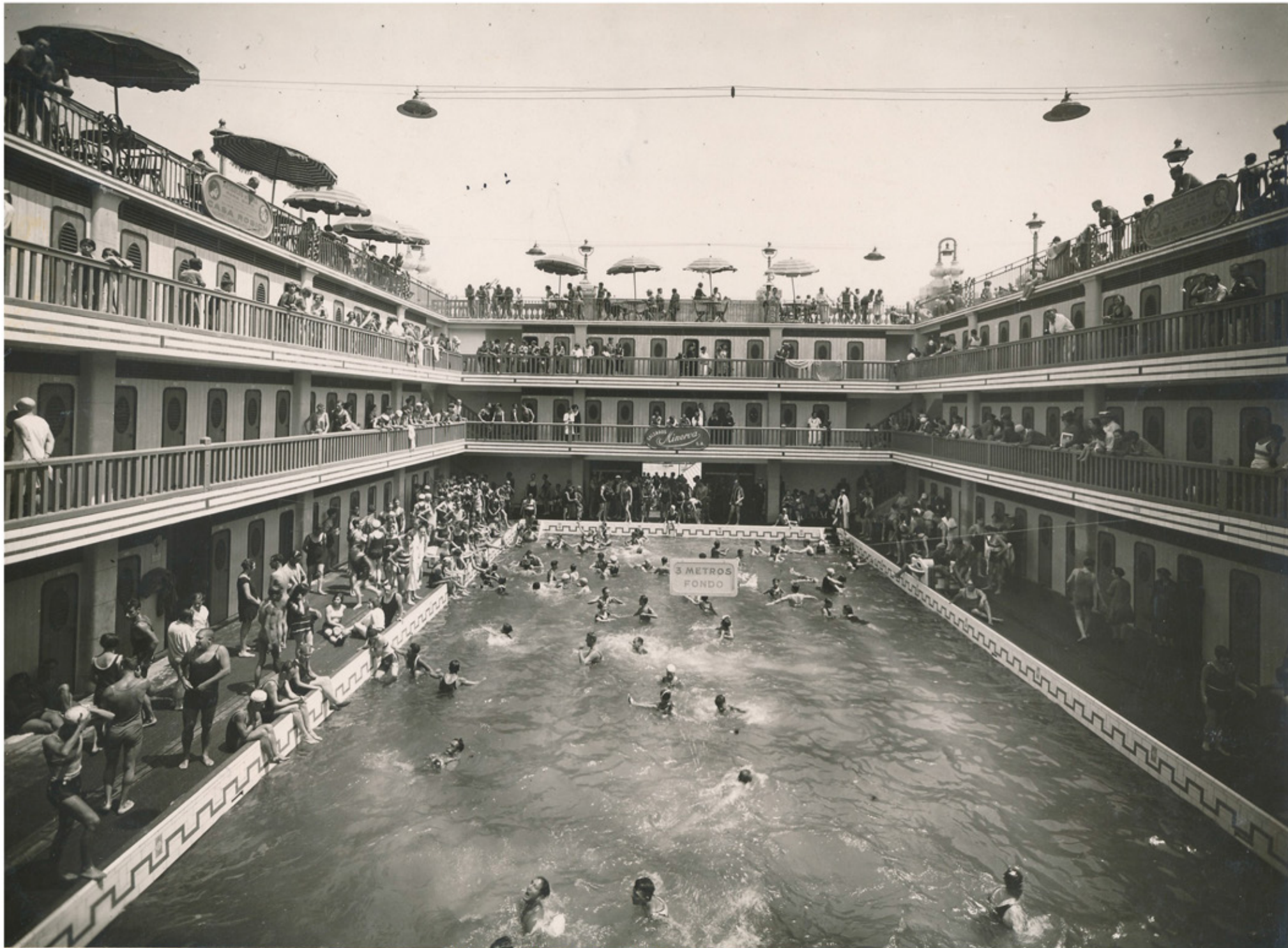
Piscina. Barcelona - Fecha: c.1930