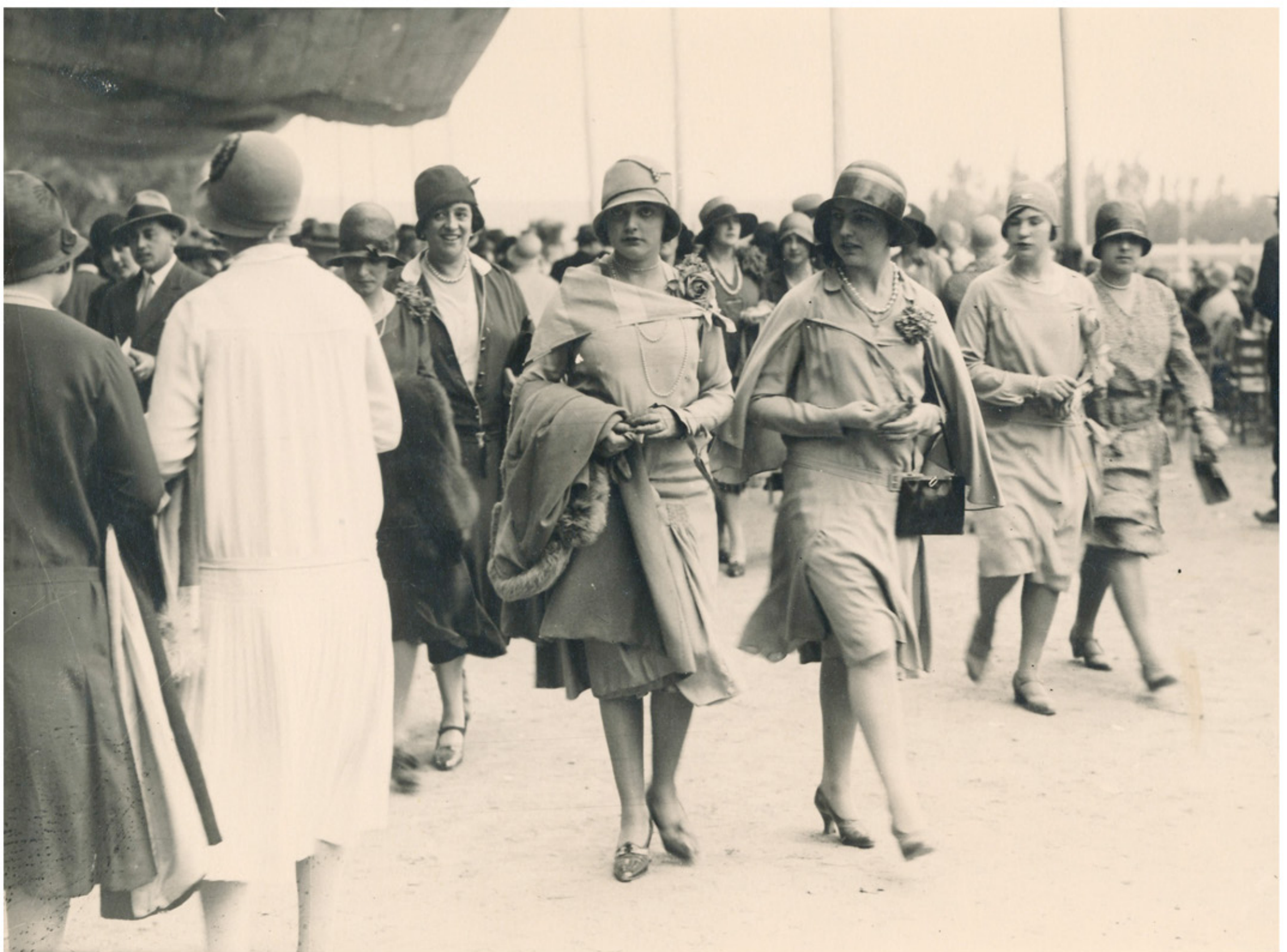
Un paseo en el hipódromo de Sevilla - Fecha: ¿1921-1930?