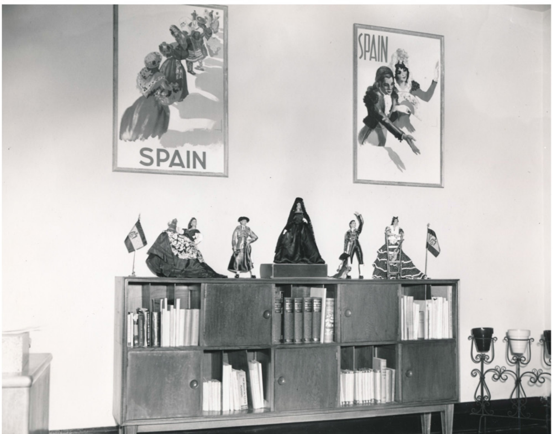
Oficina Española del Turismo en Chicago. Interior, detalle. Fecha: Marzo 1952