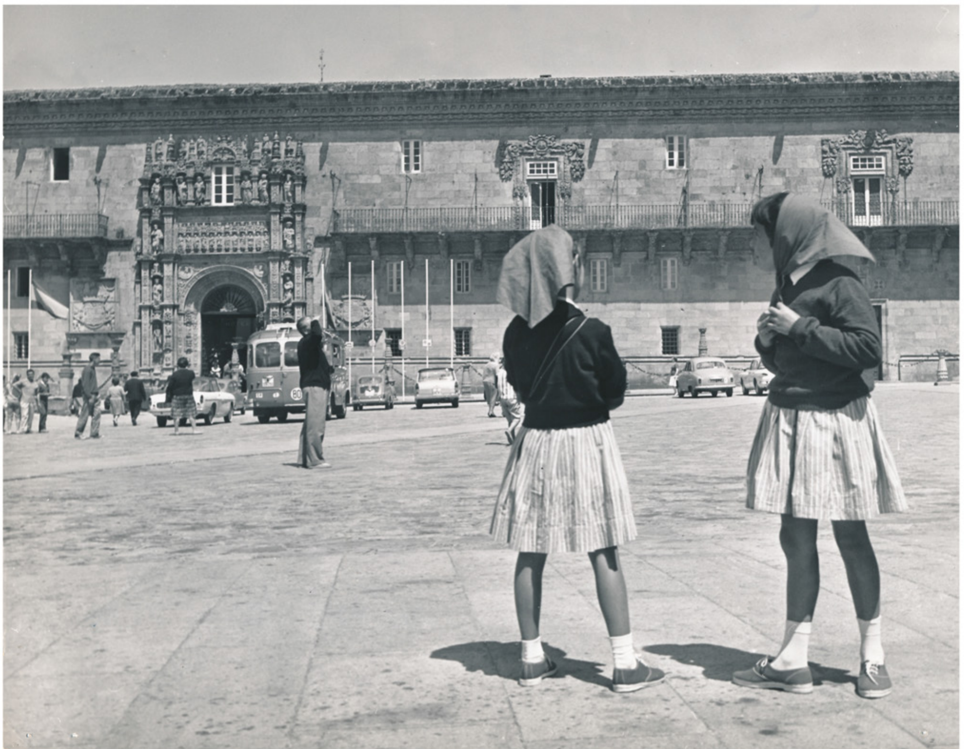
Hostal de los Reyes Católicos. Santiago de Compostela - Fecha: 1961