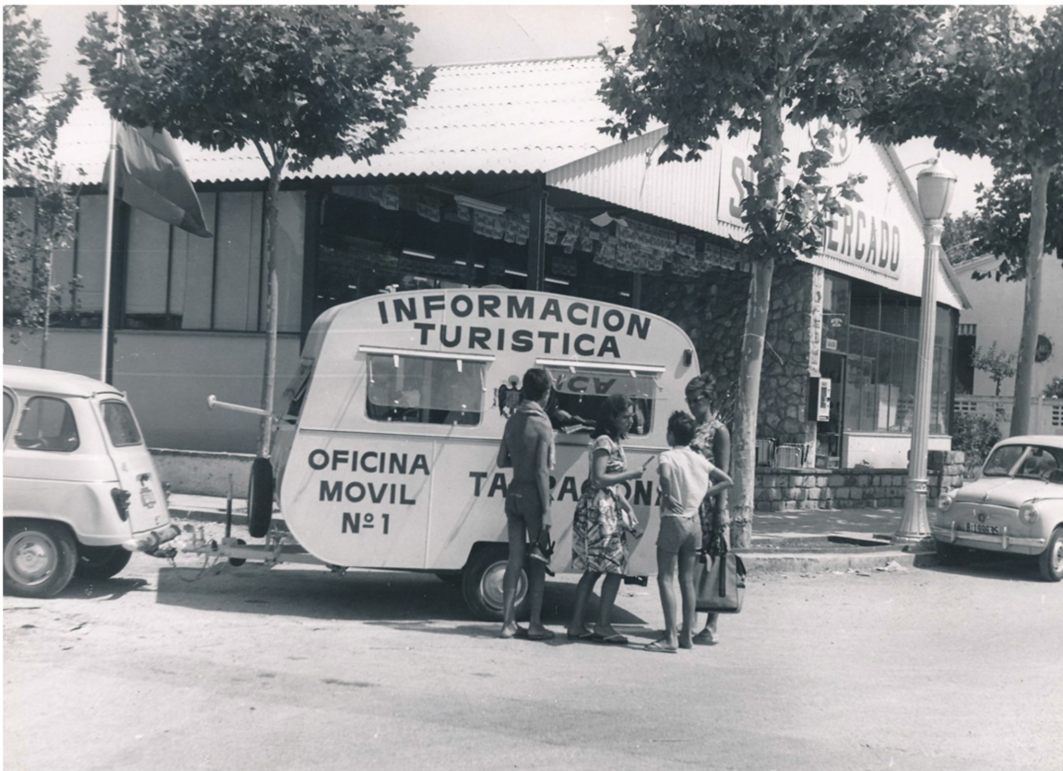
Oficina móvil de información turística. Tarragona. Fecha: 1962