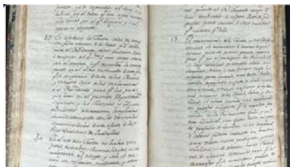
Detalle de la obvia página del manuscrito, a la venta por 3 900 euros