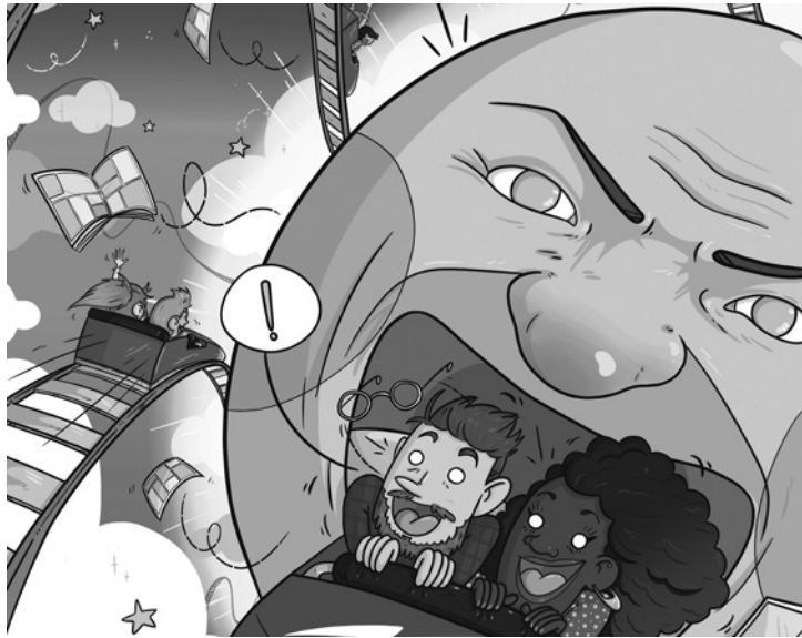
Fig. 1. Poster for the Third International Congress for Interdisciplinary Studies on Comics (2022), Sara Jotabé

reference points in this sphere. Nor can we overlook the attendees of the Second International Congress for Interdisciplinary Studies on Comics (2022), alongside the different members of the organisational and scientific committees. An event that would not have been possible without the sponsorship of the Vice Rectory of Political Sciences at the University of Zaragoza, the Gonzalo Borrás grants, the Japan, and Vestigium Reference Research Groups, the Japan and Spain Group, Relationships through art, the Aragonese Regional Association of Comic Authors (AAAC), the Zaragoza-based graphic art bookstore El Armadillo Ilustrado and the aforementioned Foundation El arte de volar . Amongst the collaborators, it would be amiss not to thank the Department of History of the Arts, the Faculty of Philosophy and Letters, the Library of the University of Zaragoza, as well as Aragón Cultura and Aragón Radio. The stunning congress poster was furthermore created by the Aragon-based author Sara Jotabé 2 (fig. 1).