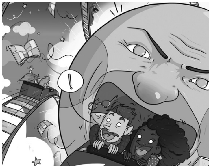
Fig. 1. Detalle correspondiente al cartel del III Congreso Internacional de Estudios Interdisciplinares sobre Cómico (2022), Sara Jotabé.

al amplio universo de la viñeta, convirtiéndose en auténticos referentes en la materia. Tampoco podemos olvidarnos de todos los asistentes al III Congreso Internacional de Estudios Interdisciplinares sobre Cómico (2022), así como de los distintos miembros de los comités de organización y científico. Un evento que no habría sido posible sin el patrocinio del Vicerrectorado de Política Científica de la Universidad de Zaragoza, la Cátedra Gonzalo Borrás, los Grupos de Investigación de Referencia Japón y Vestigium, el grupo Japón y España. Relaciones a través del arte, la Asociación Aragonesa de Autores de Cómico (AAAC), la librería gráfica zaragozana El Armadillo Ilustrado y la citada Fundación El arte de volar. Entre los colaboradores, tenemos que agradecer el apoyo del Departamento de Historia del Arte, la Facultad de Filosofía y Letras, la Biblioteca de la Universidad de Zaragoza, así como de Aragón Cultura y Aragón Radio. El estupendo cartel del congreso fue realizado además por la autora aragonesa Sara Jotabé 2 (fig. 1).