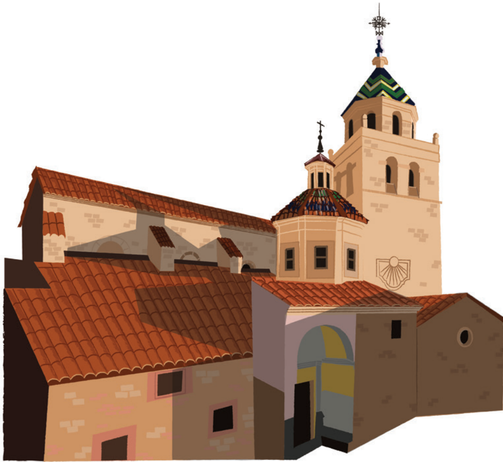
Catedral de Albaracín