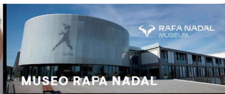
MUSEO RAFA NADAL