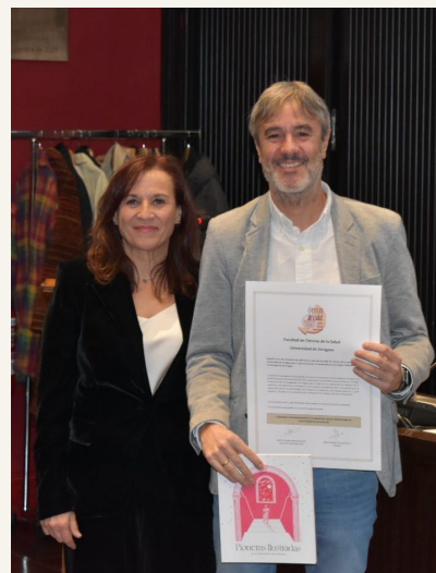
Colegio Profesional de Fisioterapeutas de Aragón