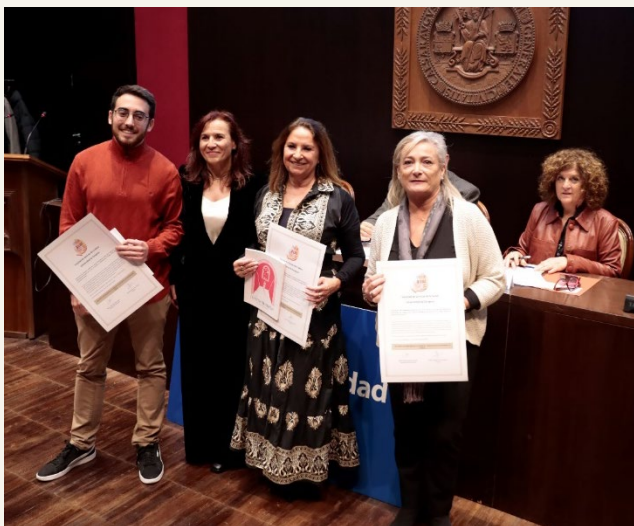
Colegios Oficiales de Enfermería de Zaragoza, Huesca y Teruel

La Junta de Centro de la Facultad de Ciencias de la Salud, en su sesión de 4 de noviembre de 2024, acuerda otorgar el Reconocimiento de la Facultad de Ciencias de la Salud a los Colegios Oficiales de Enfermería de Zaragoza, Huesca y Teruel, al Colegio Profesional de Fisioterapeutas de Aragón y al Colegio Oficial de Terapeutas Ocupacionales de Aragón, por su labor en la ordenación del ejercicio de la profesión, orientada hacia la excelencia de la práctica profesional como instrumento para la mejor atención de las necesidades de la salud de la población y del sistema sanitario y socio-sanitario, así como en la representación y defensa de los intereses de sus profesionales