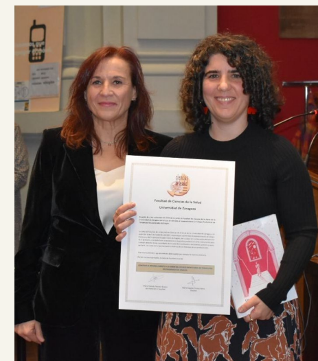
Colegio Oficial de Terapeutas Ocupacionales de Aragón