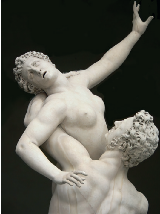
Fig. 1. Giambologna, Ratto de la sabina (detalle). Florencia, Loggia dei Lanzi.

Los relatos legendarios sobre los orígenes de Roma nos hablan del rapto de mujeres, al que atribuyen un papel esencial en el crecimiento demográfico, y, a medio plazo, en la integración política con las comunidades vecinas. El episodio más conocido es el del rapto de las sabinas, que ha inspirado, también, numerosas obras artísticas a lo largo de la historia. La tradición relata la captura de un grupo de jóvenes procedentes de la región sabina (en el interior del Lacio) que habían acudido a Roma como invitadas a una fiesta (texto 1). Al secuestro masivo de las sabinas le sucedieron los matrimonios forzosos con sus captores romanos. No mucho después, durante el inevitable conflicto bélico que se desató entre ambas comunidades, las sabinas actuarían como suplicantes ante otra mujer, Hersilia, la esposa de Rómulo según algunas versiones, para que este se apiadara de sus compatriotas derrotados (fig. 1).