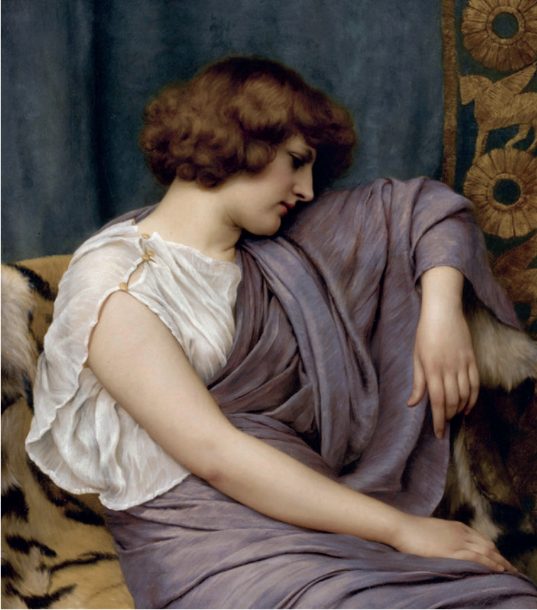
Fig. 2. John William Godward, Briseida . Col. privada.

En realidad, los romanos no parecen haber sido muy originales en sus leyendas de fundación. El secuestro de mujeres se atribuye, también, a los inicios de otros pueblos mediterráneos, como los cartagineses. Una fuente tardía, Justino, alude al rapto por los fenicios de ochenta muchachas en Chipre, donde hizo escala la expedición que fundaría Cartago. Este acto violento se llevó a cabo «para que los jóvenes pudieran casarse y la ciudad tener descendencia». Naturalmente, estos pasajes deben tomarse como literatura mítica, y no como hechos com-