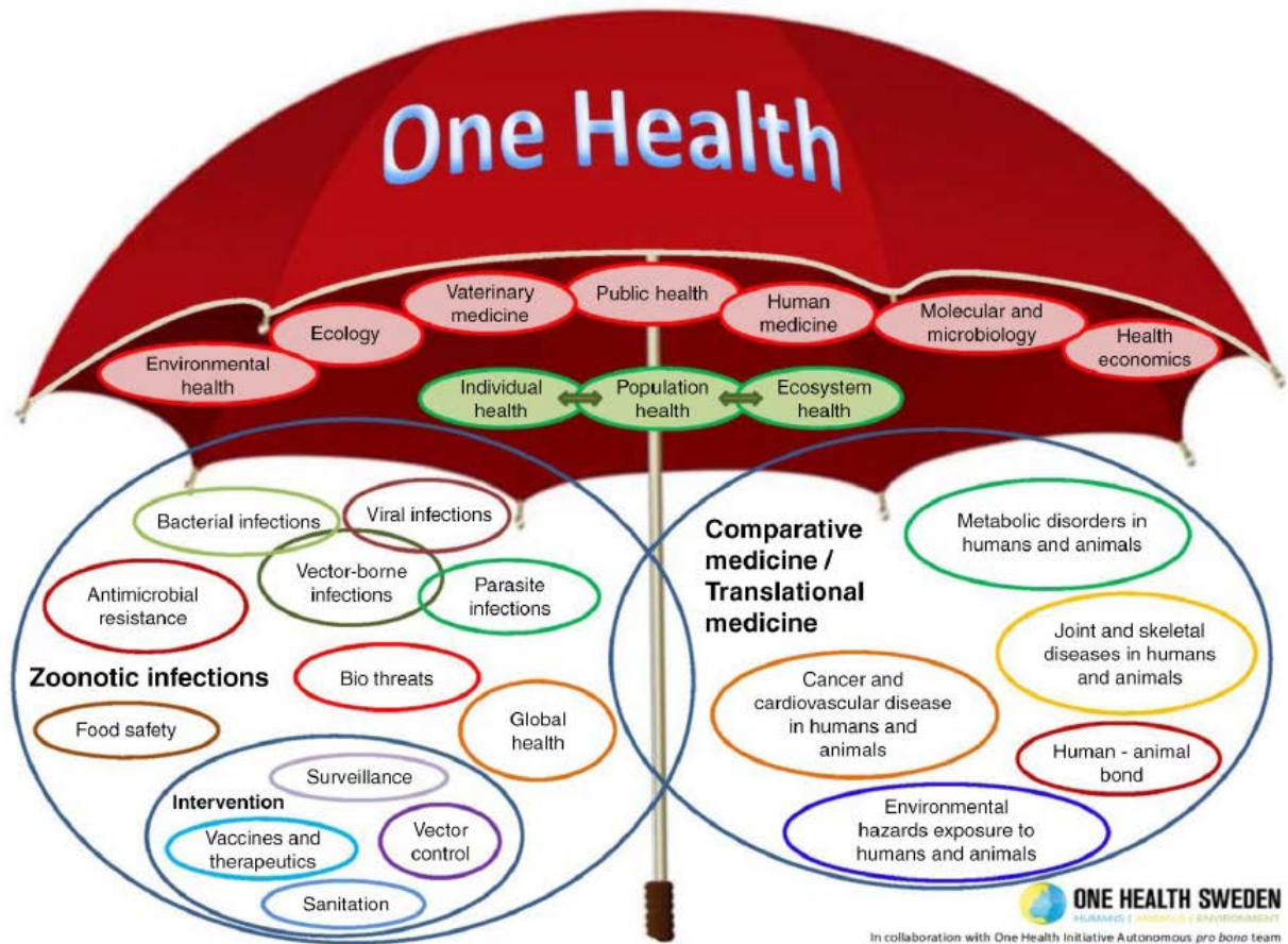
Figura 1: El "paraguas de One Health". Desarrollado por las redes "One Health Sweden" y "One Health Initiative" ilustra el alcance del "concepto One Health". Disponible en www.onehealthinitiative.com .

de la sociedad globalizada e influenciada por el propio comportamiento humano y por el cambio climático. Estos retos se deben abordar de forma multidisciplinar para lo cual el máster propuesto pretende ser un complemento a la formación de graduados de muy diversas especialidades.