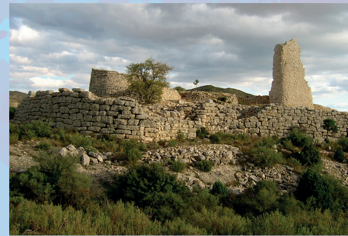
Cabezo de San Pedro en el Parque Cultural del Río Martín.