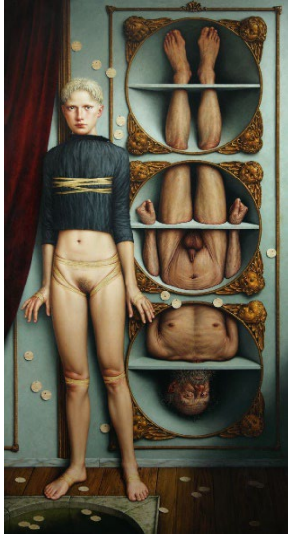
AD INFEROS (2004)