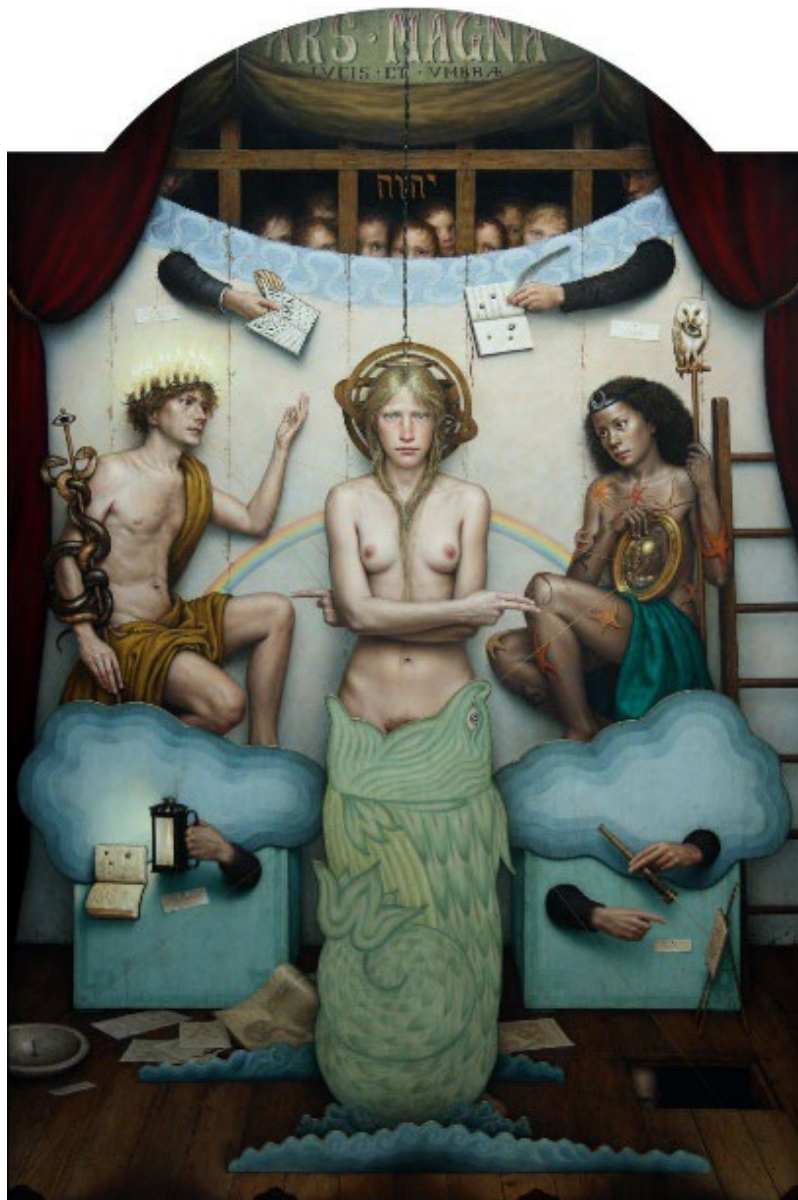
ARS MAGNA (2016)