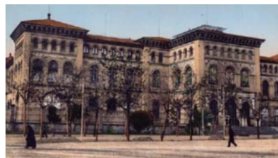
Edificio Paraninfo. Facultad de Medicina y Ciencia (año 1940). Actualmente, sede del Rectorado