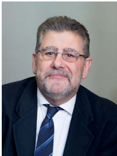
José Antonio Mayoral Murillo Rector de la Universidad de Zaragoza

La Universidad de Zaragoza es una institución pública de enseñanza e investigación al servicio de la sociedad, el mayor centro de educación superior del Valle del Ebro que combina una tradición de casi cinco siglos de historia (fue creada en 1542) con la actualización permanente de su oferta académica. Su principal misión es generar y transmitir conocimientos con el objetivo de la formación integral de las personas. Es una Universidad de calidad, solidaria y abierta que desea ser instrumento de transformación social para el desarrollo económico y cultural.