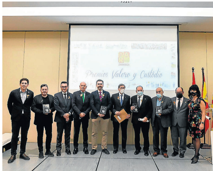
Los organizadores y los galardonados en los Premios Valero y Custodio 2022, en el hotel Zentro. FRANCISCO JIMÉNEZ

años de su vida a la docencia. El cómo ha sabido transmitir sus conocimientos y demostrar la importancia de quien le escuchaba, han sido aspectos que se han tenido muy en cuenta a la hora de conceder este premio.